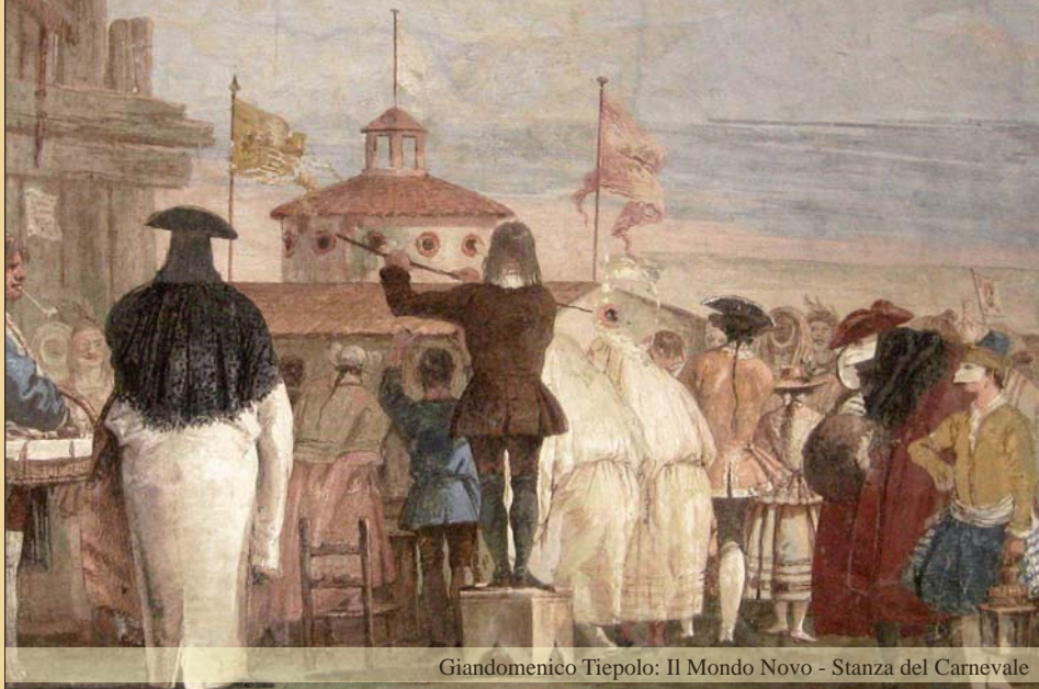
Giandomenico Tiepolo: Il Mondo Novo - Stanza del Carnevale

Villa Valmarana ai Nani - Via dei Nani, 8 - 36100 Vicenza - tel/fax (+39) 0444.321803 e-mail: valmarana@villavalmarana.com - web: www.villavalmarana.com