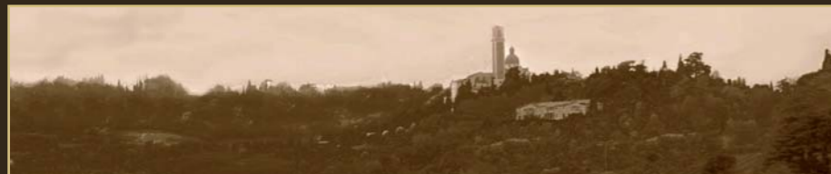
La Valletta del Silenzio con il Santuario di Monte Berico

Villa Valmarana ai Nani a Vicenza, abitata ancora oggi dalla famiglia Valmarana, è aperta al pubblico per la visita agli affreschi della Palazzina e della Foresteria, capolavori di Giambattista e Giandomenico Tiepolo (1757). Nella Foresteria e nelle antiche Scuderie sono stati ricavati tre nuovi appartamenti, immersi nel verde e nell'incanto della Valletta del Silenzio. La Scuderia, Ai Nani 1 e Ai Nani 2 , perfettamente arredati e dotati di aria condizionata e linea ADSL, sono l'ideale per chi desidera trascorrere qualche giorno a Vicenza, la città di Palladio, in un contesto molto speciale.